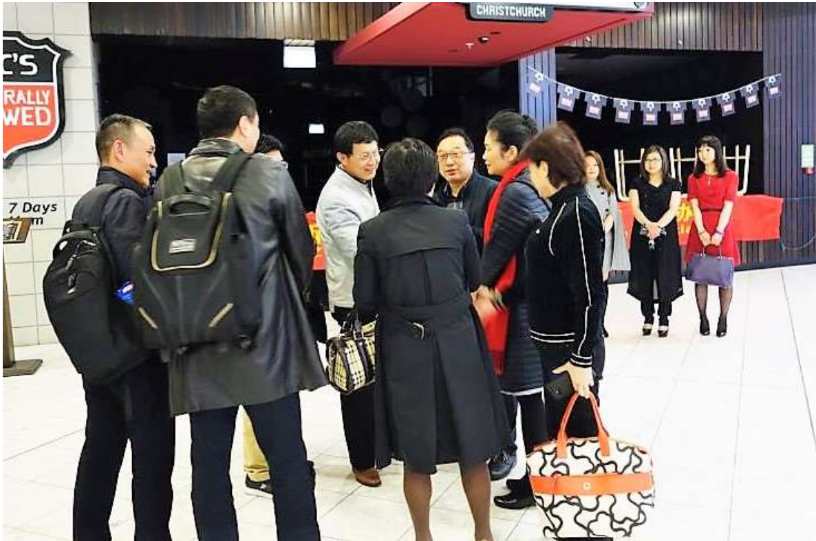
有朋自远方来，不亦乐乎！ 新西兰湖北经贸文化协会成员代表一同来到基督城机场迎接家乡领导和亲人。