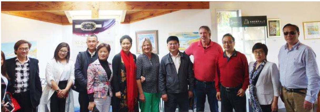
代表团在新西兰湖北经贸文化协会成员的企业“女王花园”酒庄参观考察