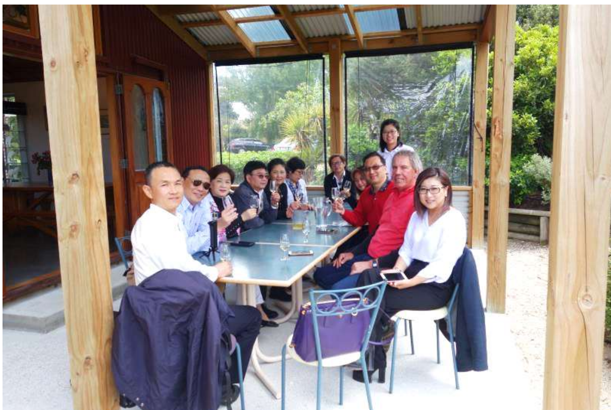
新中两国友人畅叙两地互访经历，轻松愉快地交流互动.....