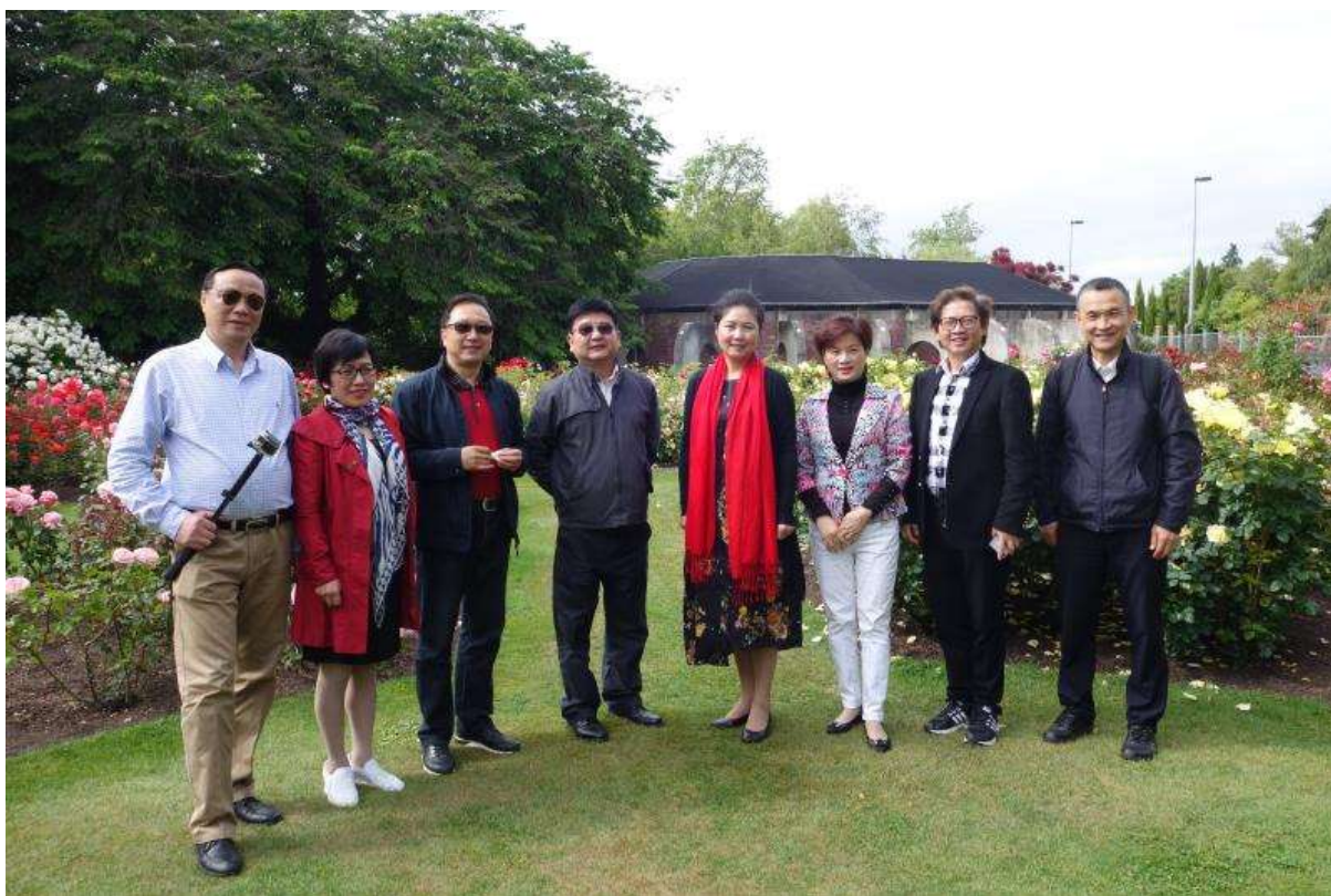
正值鲜花盛开时，访问团成员们兴致勃勃地徜徉在沁人心脾的玫瑰园。